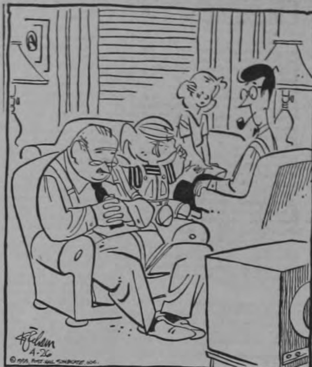
¡Silencio! ¡Que no dejan oír a abuelito su película de vaqueros!