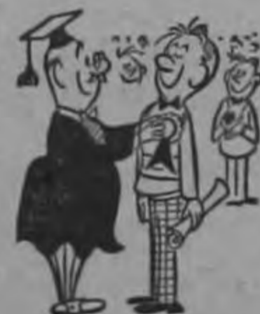
Mas tomó el grato Neuro Fosfato, * y en cada examen salió premiado.