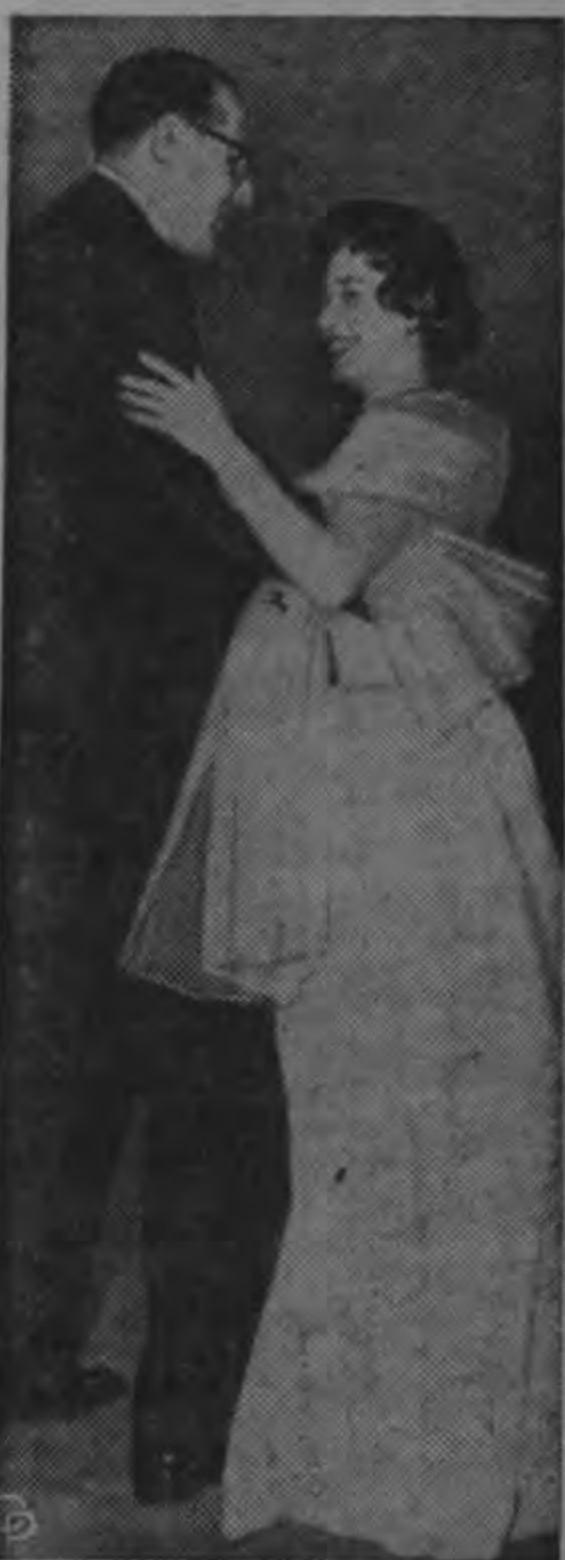
La Princesa Margarita, de Inglaterra, cuyo nuevo peinado cambia de manera decisiva su aspecto, aparece bailando con el Mayor Raymond Seymour, en el baile anual del "Sombrero Rojo" en Londres. El baile se celebra para levantar fondos para los Clubes Unidos de la Iglesia de C...