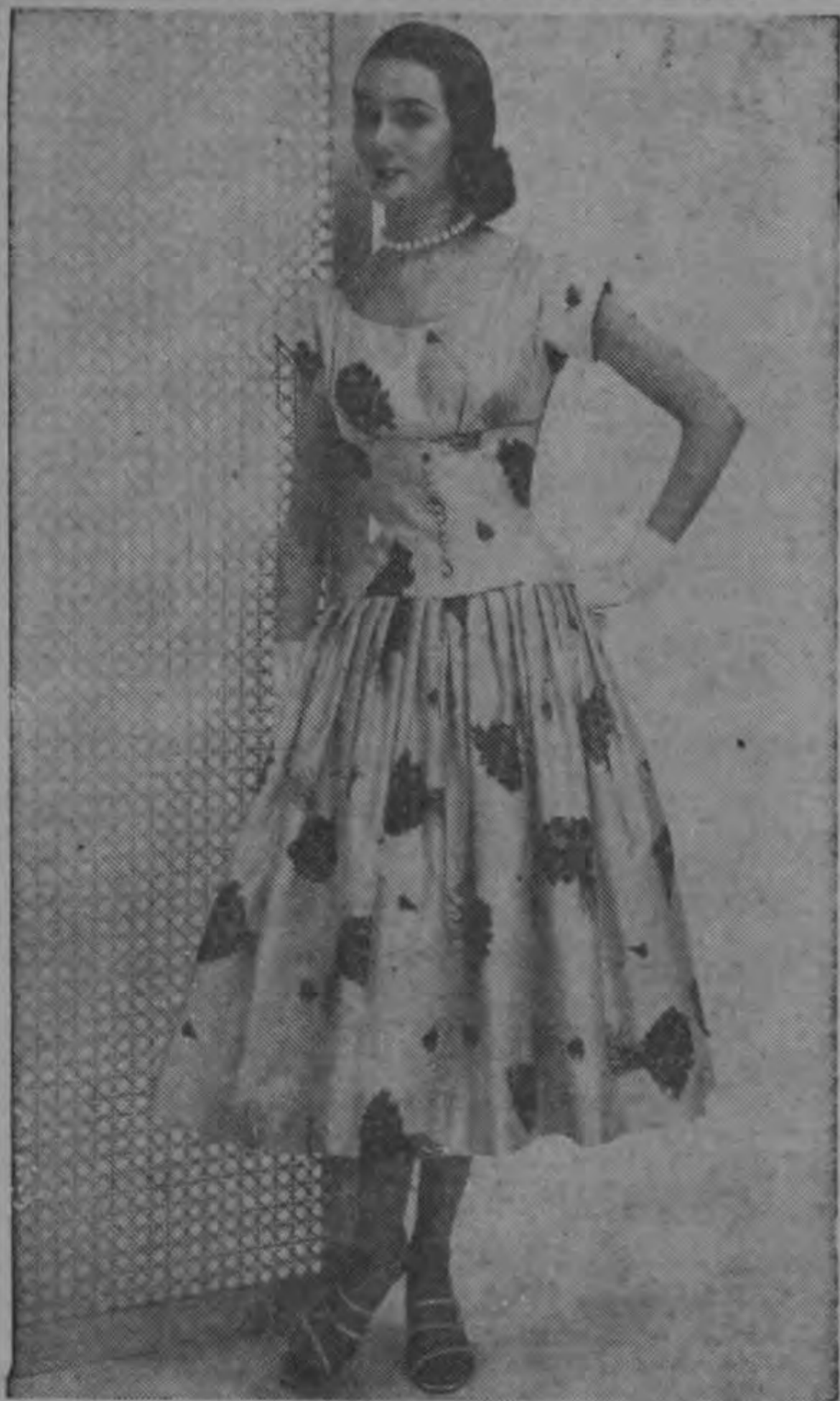
Para jóvenes altas, creación de Marsha Young, de Nueva York. Diseñado con línea imperio en la parte superior, moldea gentilmente el talle y cae en una falda de pliegues sueltos que dan una graciosa impresión de suavidad al par que esbeltez. Como motivo decorativo lleva estampados de ramos de violetas.