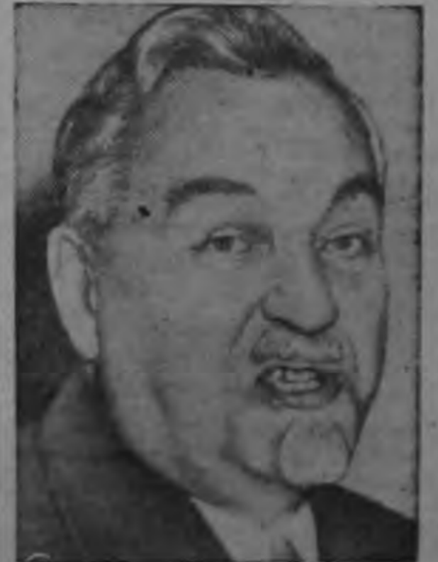
Este retrato de primer término del Premier ruso Nikolai A. Bulganin se tomó en Londres poco antes de su regreso a Moscú con su compañero de viaje, Nikita S. Khrushchev, Primer Secretario del Partido Comunista ruso.