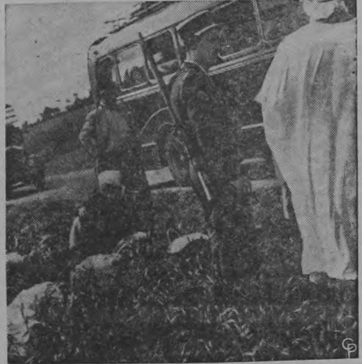
En una barricada en Argella, las tropas francesas examinan a los pasajeros de un ómnibus en busca de sospechosos después del último brote de terrorismo. Todos los vehículos son detenidos y registrados para ver si llevan armas.