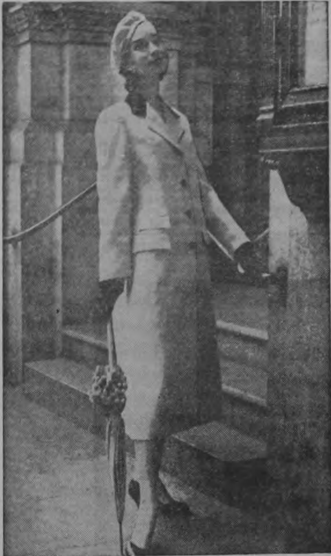
Abrijo de primavera de tela de lino "Moygashel", especialmente resistente al agua. Estilo Chestertield, creación de la casa Lawrence, de Londres. Es de color crema, con cuello de terciopelo negro. El sombrero es del mismo material.